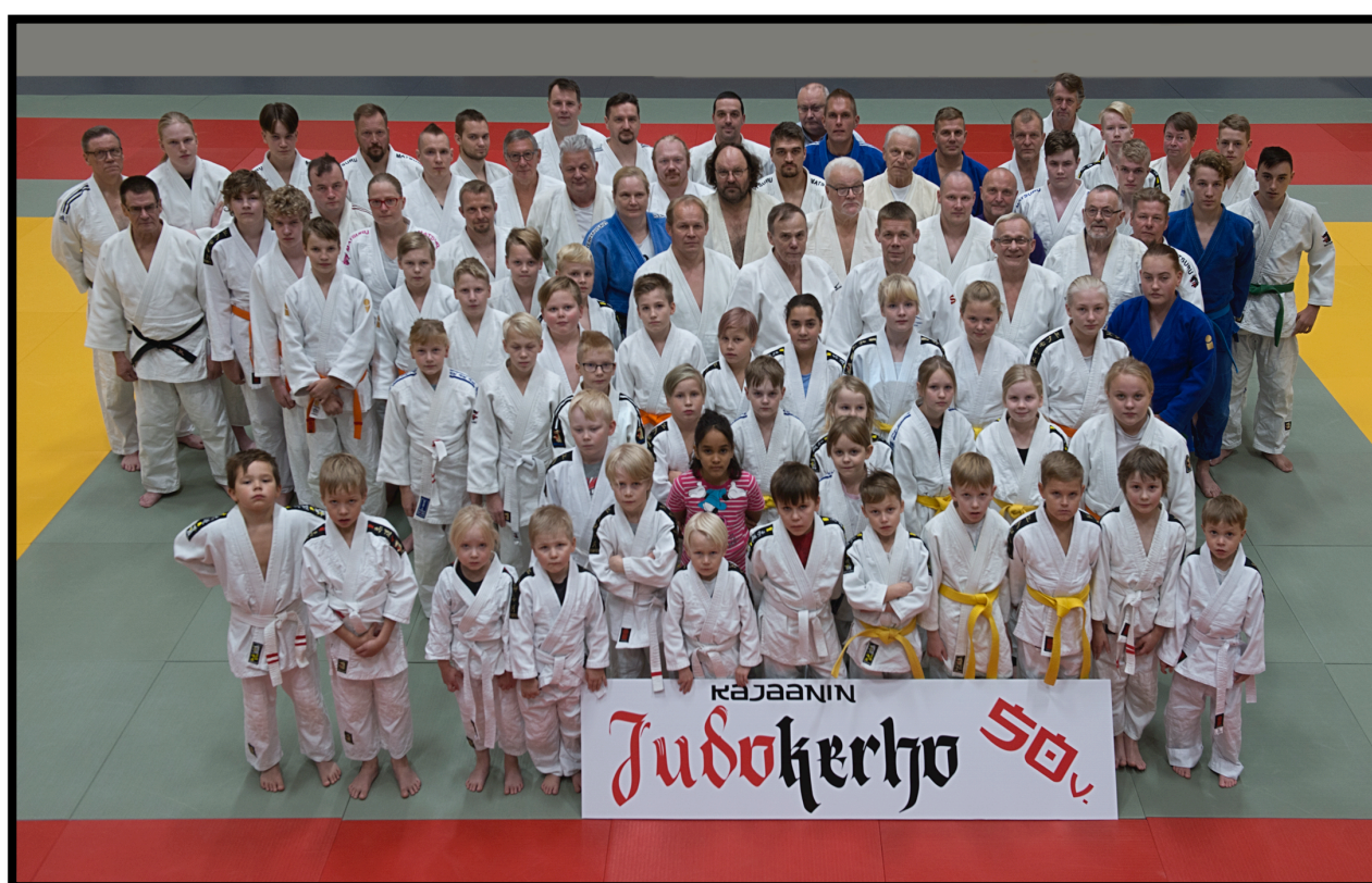
6.10.2018 Juhlaharjoitukseen osallistuneet judokat